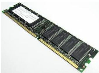
Barrette de RAM

Les données sont stockées provisoirement. Une fois l'ordinateur éteint, les données s'effacent. Plus la carte est puissante, plus elle peut traiter de données simultanément.