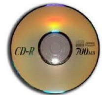
CD / DVD

Elle stocke les données indispensables au démarrage de l'ordinateur. Elles ne s'effacent jamais